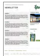
TPA E-Mail Newsletter