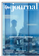
TPA Journal-Abo 3 mal jährlich wichtige Hintergrundinfos