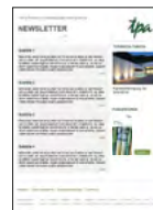
TPA E-Mail Newsletter